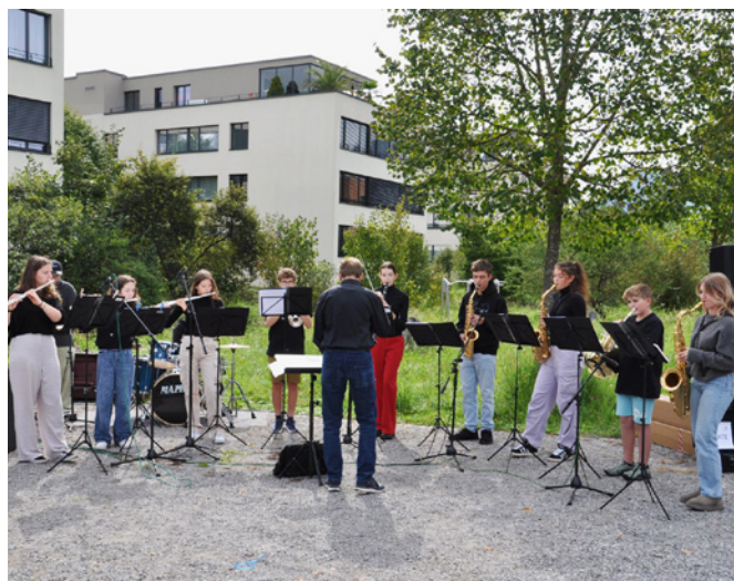
Weitere Einblicke unter leistobereau.ch